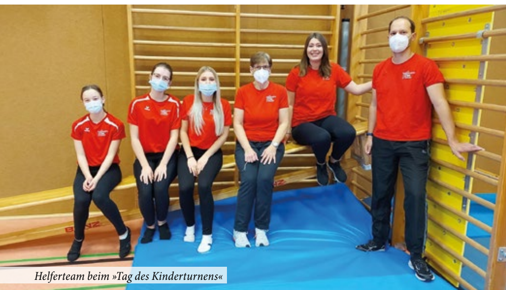
Helferteam beim »Tag des Kinderturnens«

Eine weitere Veranstaltung ist im Frühjahr geplant.