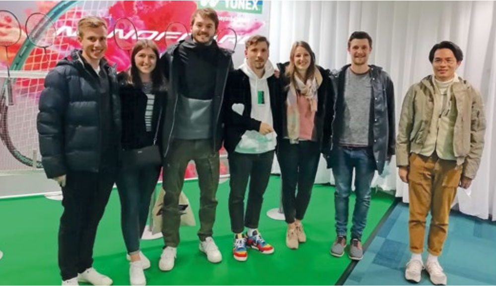
Zugeschaut und was dazu gelernt: unsere Spieler und Trainer zu Besuch bei den Hylo Open in Saarbrücken.

entfernte Stadt zu besuchen und uns bei den Topspielern eine Scheibe abzuschneiden. Am 7. November konnten wir die eindrucksvollen Finalsätze anschauen und einen tollen Tag genießen.