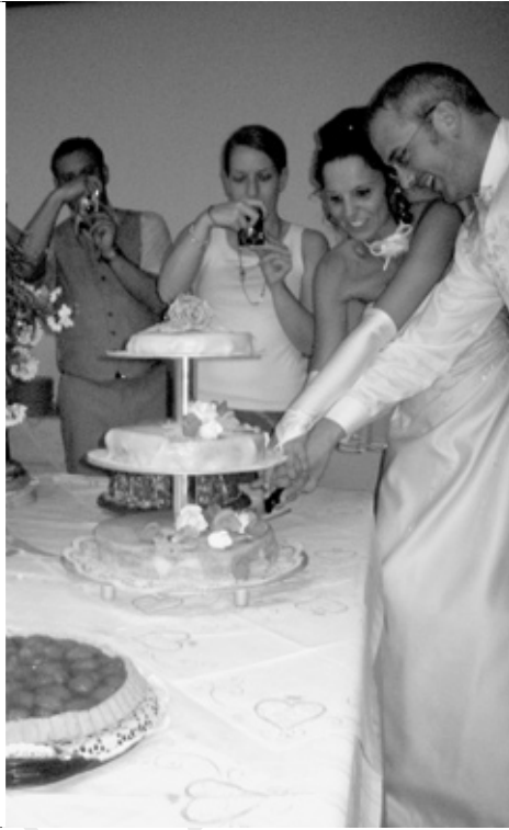
Das Brautpaar beim Anschneiden der Hochzeitstorte.