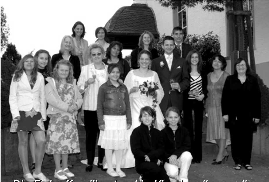
Die Eislauffamilie stand in Kirschweiler spalier.