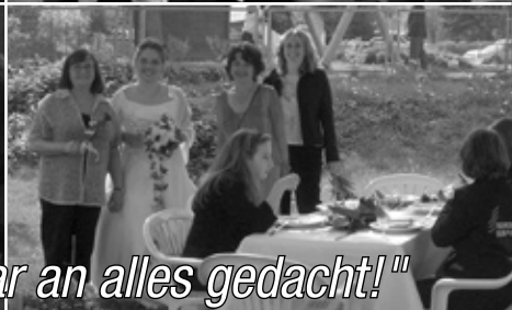
Wir danken: "Es war an alles gedacht!"